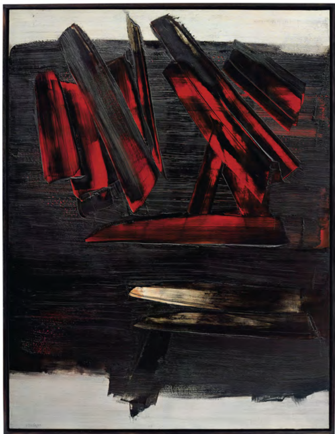
Pierre Soulages, Peinture,

1959, huile sur toile, 186 x 143 cm. Adjugé 10 600 000 $ (9 355 365 €).