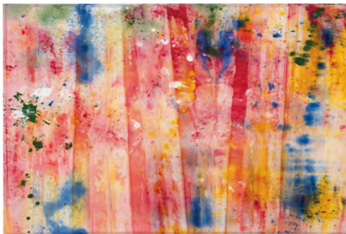
Sam Gilliam, Lady Day II, 1971, acrylique sur toile, 271,8 x 406 cm. Adjugé 2 172 500 $ (1 902 273 €).